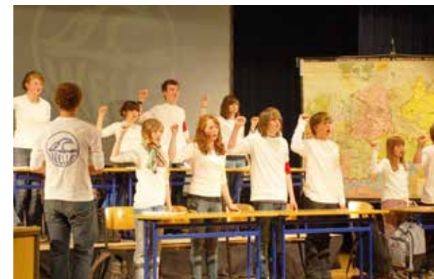
Szene aus „Die Welle“