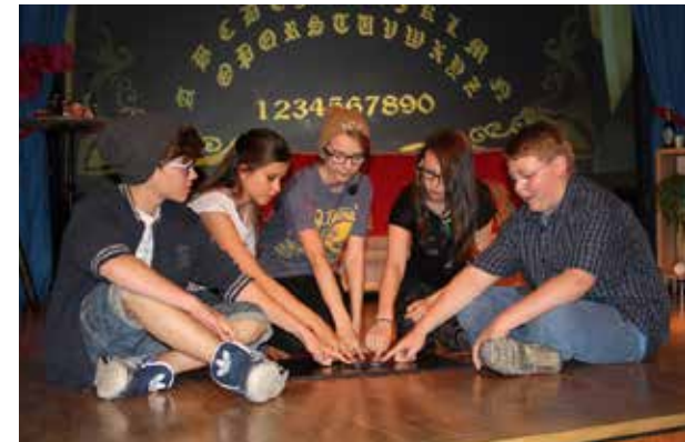
Szene aus „Traumpaar“